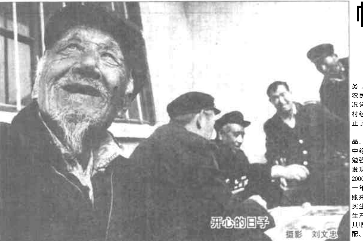
帐本里面看变化 农村记帐是统计工作一项长期的重要任务，政府将印制的正式帐本送到农民手中，农民以家庭为单位将每天的现金及实物收支情况详细记录下来，小小帐本，成了国家了解农村经济状况的重要途径，同时通过记帐，也改正了一些农民的不良消费习惯。

记帐初期，农民的日常消费如烟、酒、食品、礼金等占总消费支出的70%，而收入来源中绝大多数仍是从种植业中的固定收入，只是勉强解决了温饱问题。通过长期记帐，农民们发现一年下来，只是烟、酒二项累计最少也得2000多元，此外还有许多不必要的杂费开支，一年几乎要浪费三、四千元。于是他们通过记帐来监督日常开支，将节省下来的资金用于购买生产资料，开发第二、三产业。现在农民的生产性支出逐步提高，生活性支出逐步优化，其收入来源也呈现多元化；交通运输、修理修配、餐饮服务、种植大棚……。（张水莲）